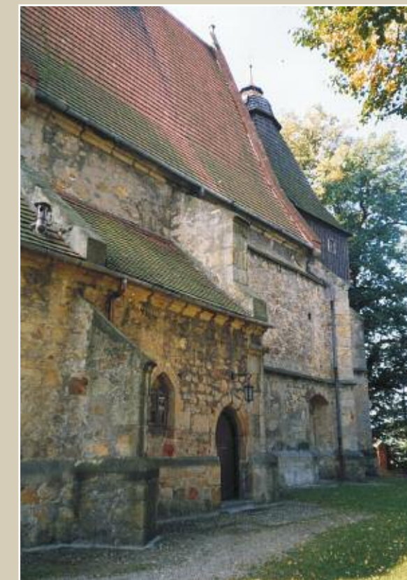
Kościół pw. św. Małgorzaty w Dębnie od strony północnej