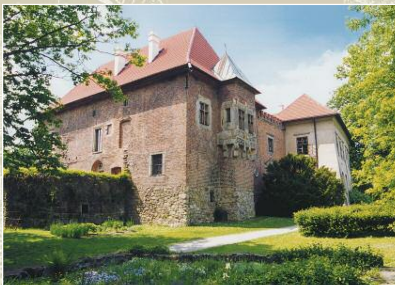
Zamek w Dębnie od strony północno-wschodniej