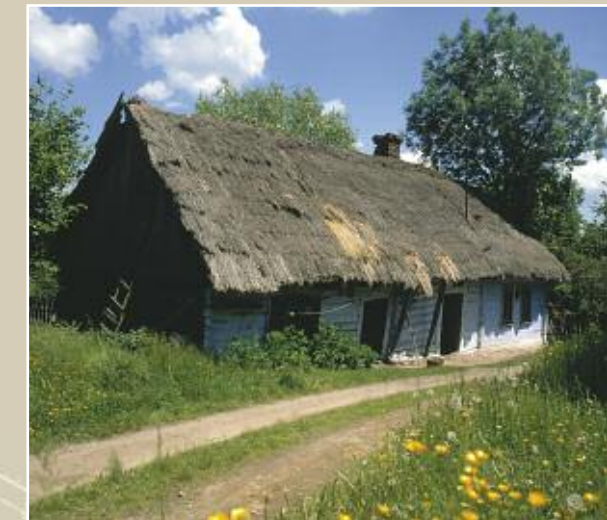
Chałupa z 1867 r.