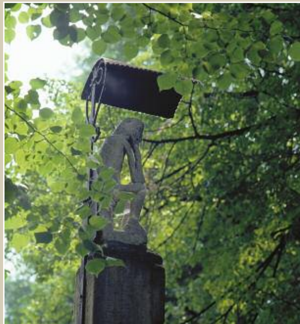
Figura Chrystusa Frasobliwego z 1 poł. XVIII w. przed cmentarzem w Dębnie.