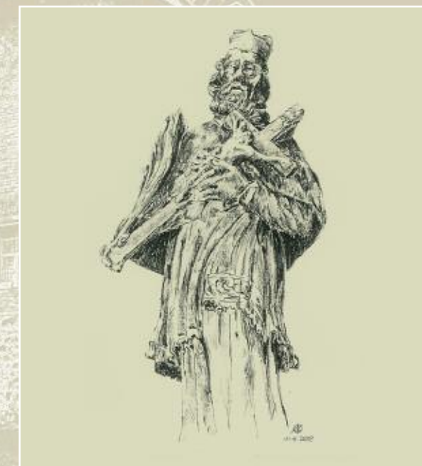
Pomnik św. Jana Nepomucena w Sufczyźnie, rys. A.B. Krupiński, 2000 r.

sta w posagu wieś Franciszkowi Ksaweremu Wykowskiemu. W czasie rabacji chłopskiej w roku 1846 w dwo-