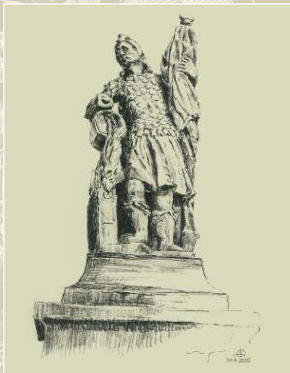
Rzeźba św. Floriana z XVIII w. w Dębnie