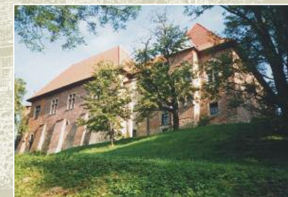
Zamek w Dębnie – widok od południowego wschodu

elementach obronnych, dekorowanej zendrówką oraz odkuwanymi w kamieniu obramieniami okien i drzwi, występującymi w obrębie baszt i malowniczych wykuszy, a także w wielu wnętrzach. W roku 1583 budowlę kupił Ferenc Wesselini, węgierski baron i szambelan dworu króla Stefana Batorego. Za jego czasów zamek nabrał późnorenesansowego wyglądu za przyczyną tynków elewacyjnych, sgraffit, attyki nad budynkiem warowni od strony północnej, malowideł i znanych tylko