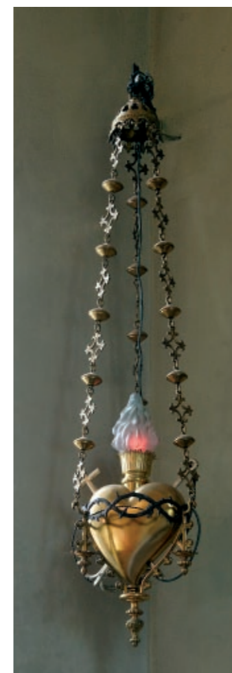
Lampka wieczna przywieziona przez repatriantów z Radochonic.