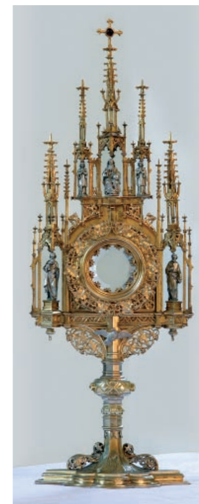
Monstrancja gotycka z Melchizedekiem pozłacana, XIX w.