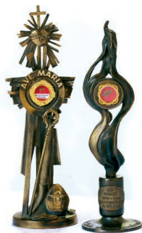
Relikwiarze – św. bp. Józefa Sebastiana Pelczara (po lewej) oraz bł. ks. Jana Balickiego (po prawej).