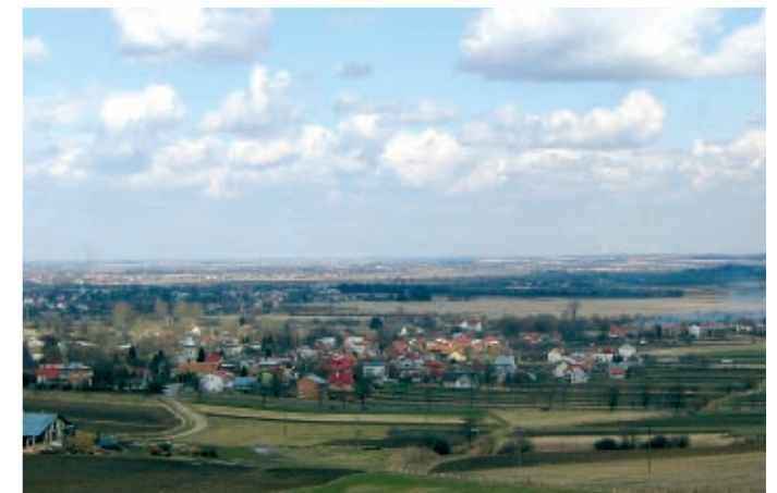
Pejzaż z kościołem. Widok Nehrybki z Optynia.

Ważne fakty historyczne dotyczące naszej wsi zawiera Słownik geograficzny Królestwa