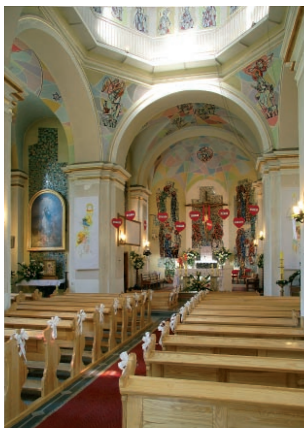
Nawa główna z widokiem na stronę południową.