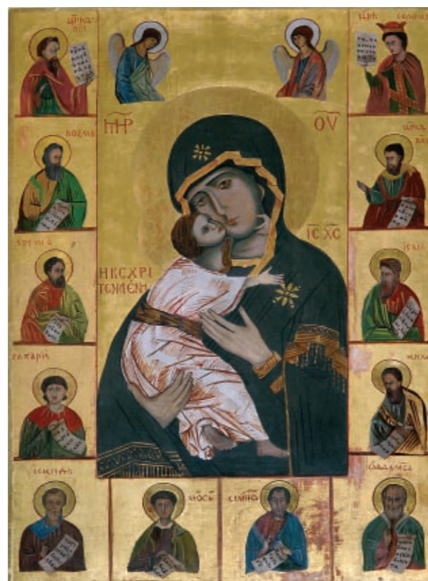
Kopia ikony Matki Boża Włodzimierskiej.