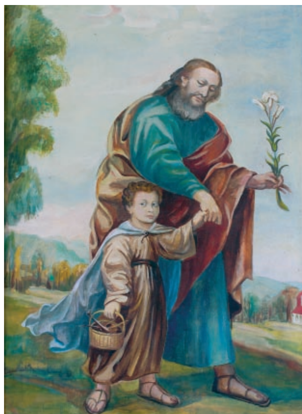
Obraz Świętego Józefa w nawie południowej, kopia obrazu z Kościoła O.O. Karmelitów z Przemyśla, mal. Stanisław Filip.