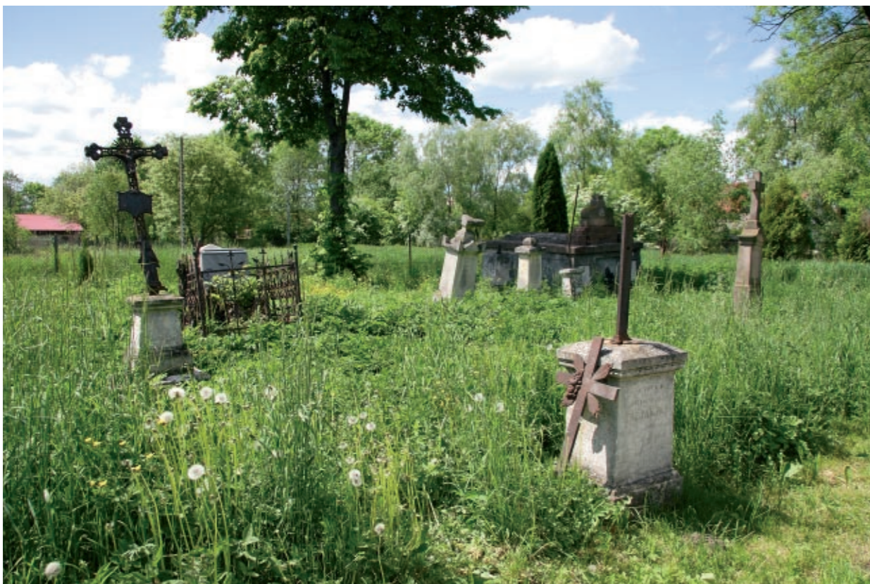
Część cmentarza z najstarszymi nagrobkami.

Ту спочиває Юлія Савицька дочка-Василаі-Катарини- * 17. 08.1906 + 10. 07.1929 Йоан Савицькый * 7. 07. 1929 + 27. 10. 1929 Василь Савицькый 04. 1866 + 23. 03. 1942