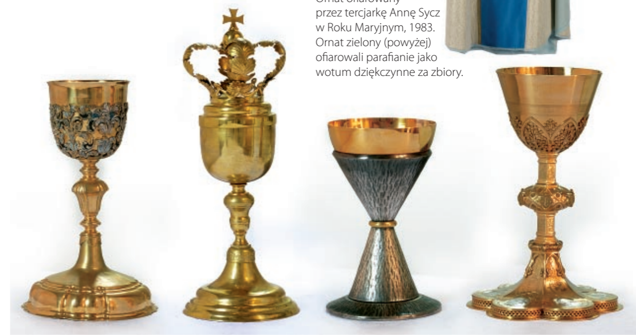
Najcenniejsze naczynia liturgiczne, od lewej: kielich złoty inkrustowany, puszka gotycka, kielich mszalny pozłacany, kielich złoty z wizerunkami świętych.