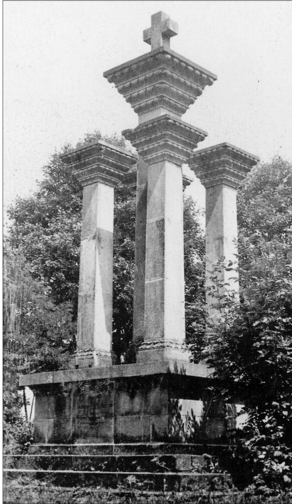
Cmentarz wojenny Nr 8 Żmigród. Projektował Dušan Jurkovič. Kriegerfriedhof Nr. 8 Żmigród. Entwurf Dušan Jurkovič.