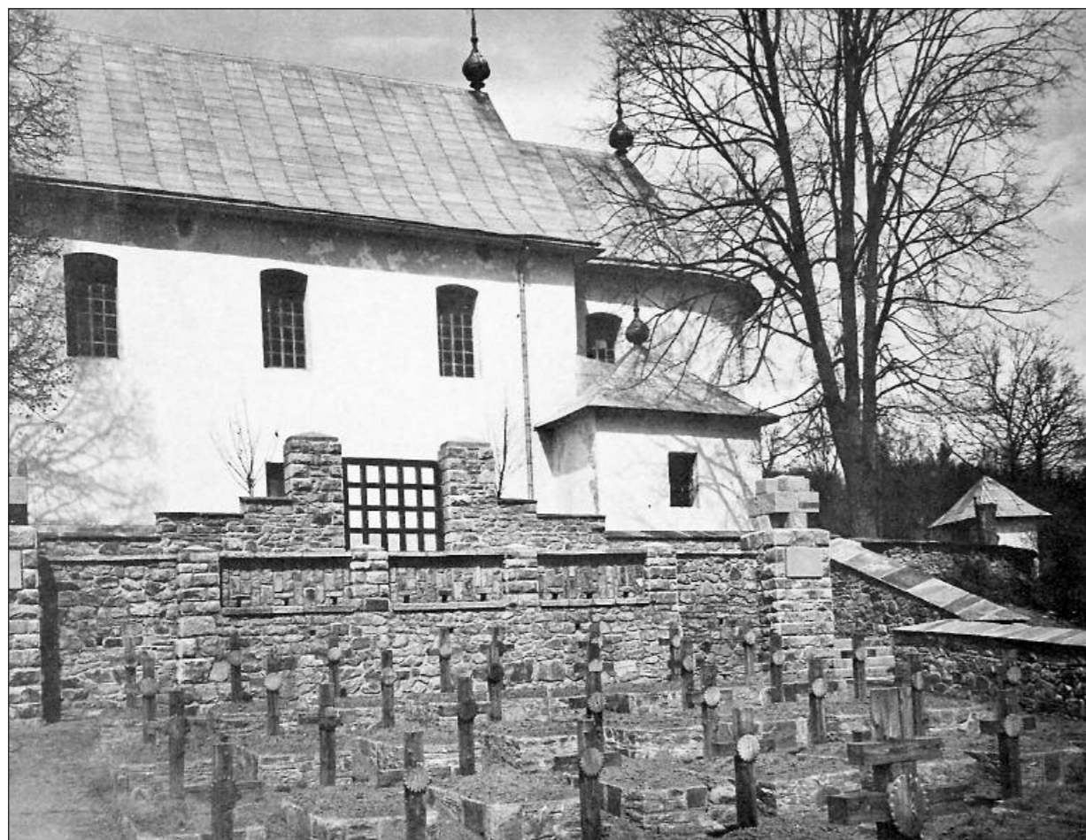
Cmentarz wojenny Nr 7 Desznica, ok. 1918 r. Projektował Dušan Jurkovič. Kriegerfriedhof Nr. 7 Desznica, um 1918. Entwurf Dušan Jurkovič.